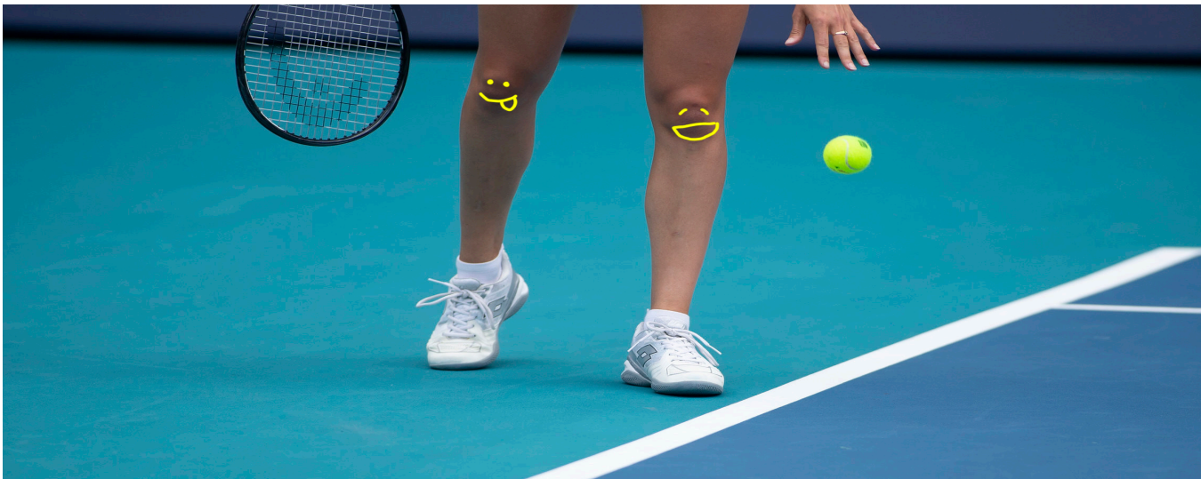
Film poglądowy jak powstaje nawierzchnia na turnieju US Open: