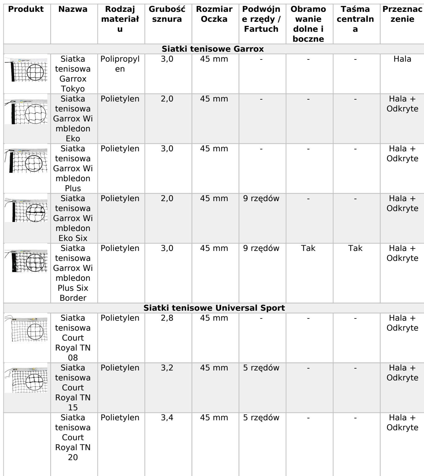
Tabela wyboru siatek do tenisa: