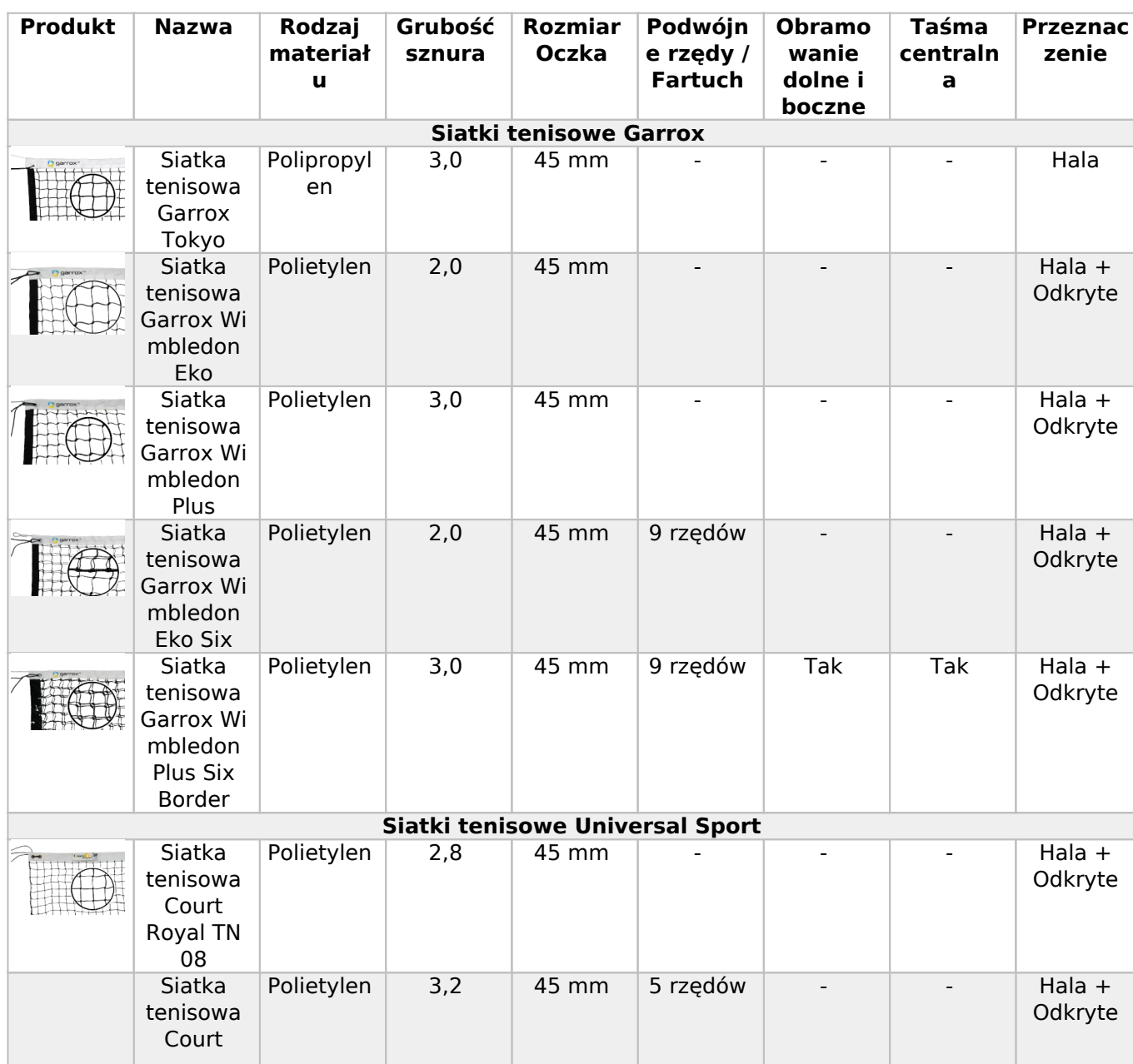
Tabela wyboru siatek do tenisa: